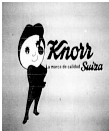
Figura 7 (Vicente et. al , 2012). Spot televisivo para caldos Knorr elaborado en los 70 por Producciones Creativas.