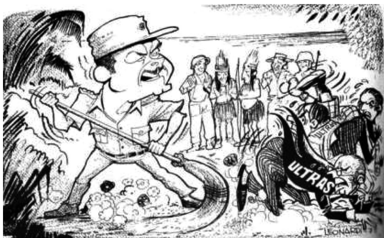
Figura 14 ( La Nueva Crónica , 9 de octubre de 1972: 11). Caricatura en la que se buscaba instruir sobre el valor de la multiculturalidad de la nación peruana y cómo la fiera caudillista del general Velasco (rostro fiero, en movimiento, erguido) resultaba una conducta ejemplar frente a la figura de los «ultras»: arrastrados, asustados, rabiosos, barridos por la fiera del general. Caricatura de Víctor Leonardi.