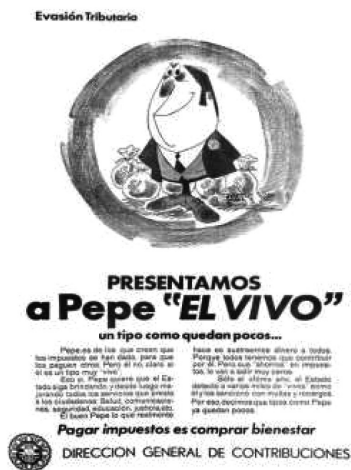
Figura 11 ( La Prensa , 6 de octubre de 1973: 7). A fines de octubre de 1973, aparecía la propaganda en prensa escrita, bajo el auspicio de la Dirección General de Contribuciones. La campaña central estuvo a cargo de Causa Perú S.A., bajo el trazo original de Félix Basauri Vargas, el creador del personaje (7 Días..., 1974: 20-23).