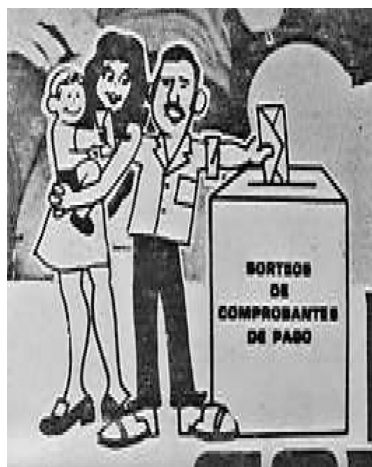
Figura 9 ( Extra , 29 de enero de 1975: 5). Caricatura para El Banco de la Nación utilizada para asociar el pago de los impuestos con la familia. La metonimia fue una figura retórica muy utilizada durante el régimen.