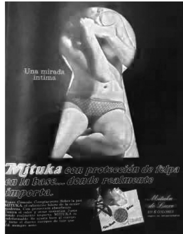
Figura 4 ( Caretas , dic. 1972 a enero de 1973, N° 470: 55). Obsérvese la misma distribución para los anuncios publicitarios: título, cuerpo y cierre. Sin embargo, el eslogan aquí está más distribuido en escenarios dispersos («Una mirada íntima») e incluso es más extenso («Mituka... donde realmente importa»). Sin embargo, el mensaje lingüístico es menor en comparación con la propuesta icónica.