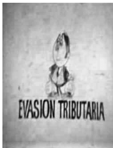
Figura 12. Plano inicial del spot televisivo Pepe, El Vivo a cargo de Cine Animado. El spot fue, probablemente, emitido a fines de 1973. Este trabajo de animación fue encargado por el Banco de la Nación. La labor de animación estuvo a cargo de Hugo Guevara Canal (Rivera, 2010: 74).