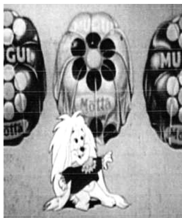
Figura 8 (Vicente et. al , 2012). Spot televisivo perteneciente a chocolates Mugui, de Motta. Fue realizado, también, por Producciones Creativas. Emitido a inicios del 70.