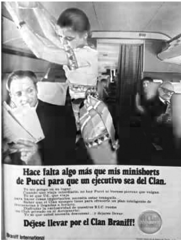
Figura 3 ( Caretas , 6-20 de julio de 1972: 48). Obsérvese la estructura del aviso publicitario: título, cuerpo y cierre. Hay aquí una proporción entre el mensaje lingüístico y la proporción icónica. Culmina con el logotipo de la marca, el eslogan («Déjese llevar por el Clan Braniff») y la marca: Braniff International.