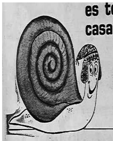
Figura 10 ( La Prensa , 13 marzo de 1971: 12). Caricatura de un caracol sonriente que porta un curioso chullo. Este afán de asociar peruanidad con persistencia resultó muy llamativo. Publicidad para Asincoop (Alianza Sindical Cooperativa), una caja de ahorros del velasquismo creada para la obtención de viviendas.