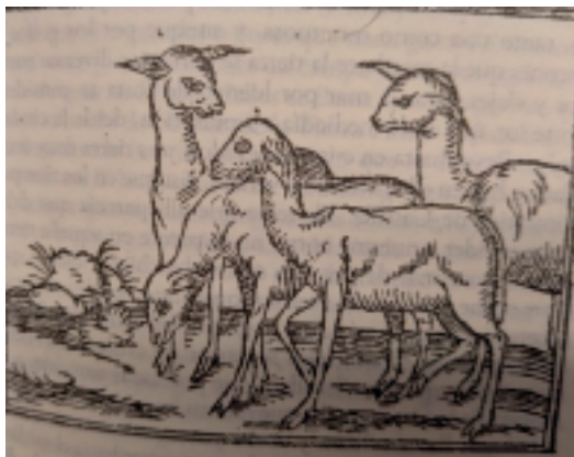
Ilustración de llamas en la crónica de Zárate

Nota. Extraída de Historia del descubrimiento y conquista del Perú , por A. de Zárate, 1555/2022, lib. III, cap. 2.